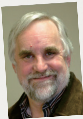
大衛·平 / 安妮·克里帕德 | 簡介

◎大衛·平一位深具洞見的作家、特會講員與退修會領袖，二十多年來從事教牧諮商、福音外展及人際互動教學等。目前是「國際裝備事工中心」(Equipping Ministries International, 簡稱EMI) 執行長，該中心在全球累計共訓練多達五十萬名牧者、傳道同工以及志工領袖。大衛是人際關係建造系列課程的創辦者，也是《Q型領袖》等暢銷書的作者。